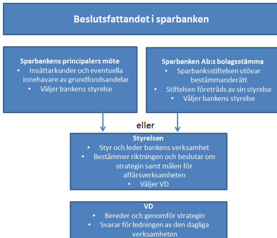
Schema: Sparbankens beslutssystem